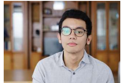
01 Januari 2023 10:03:20 3/12