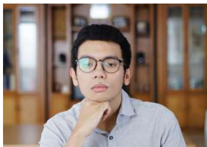
01 Januari 2023 10:06:20 5/12