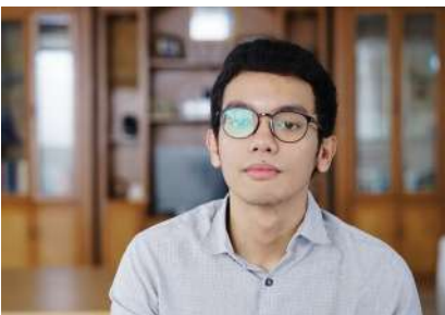
01 Januari 2023 10:12:20 7/12