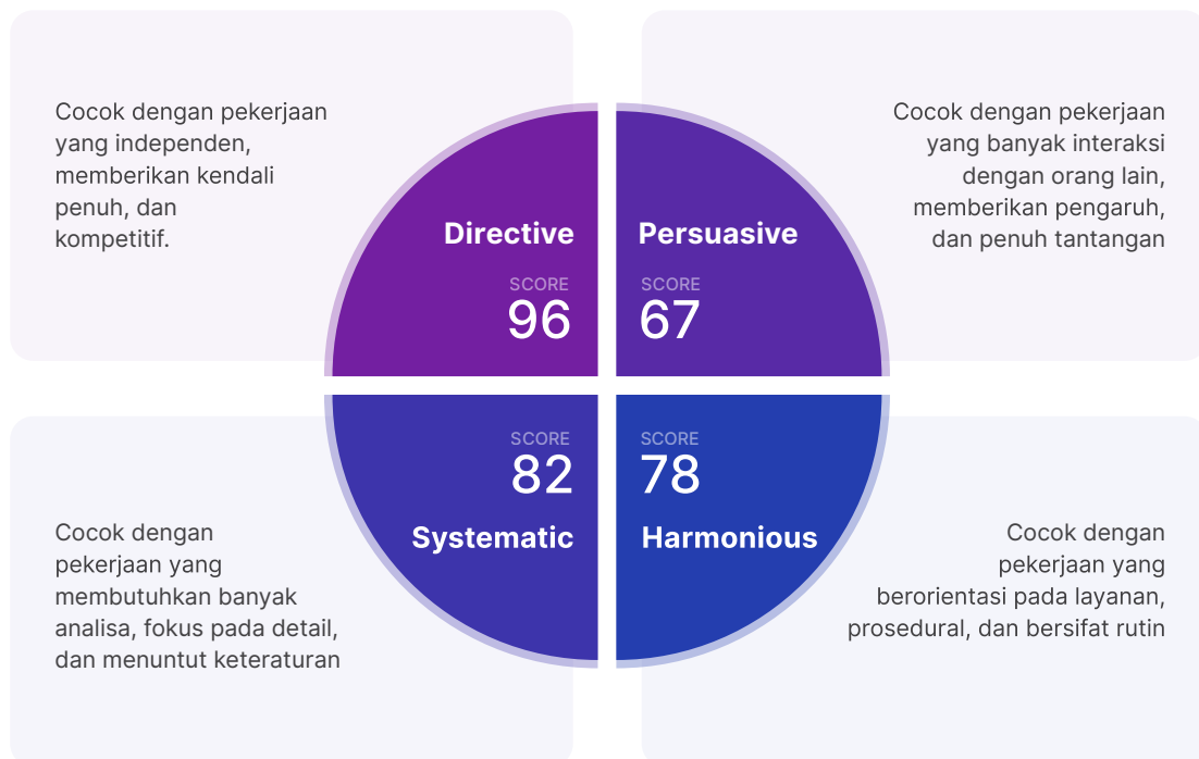
Grafik 1. 4 Tipe Work Profile