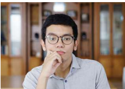
01 Januari 2023 10:05:20 4/12