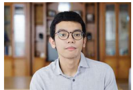
01 Januari 2023 10:10:20 6/12