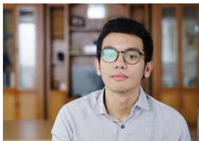
01 Januari 2023 10:25:20 11/12