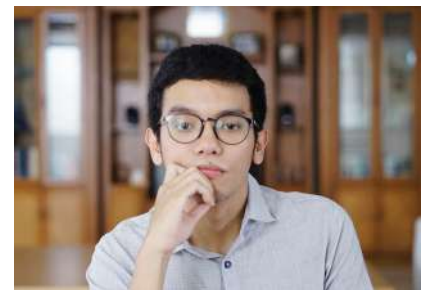
01 Januari 2023 10:18:20 9/12